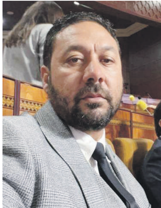
حاتم بن رقية النائب البرلماني عن حزب التجمع الوطني للأحرار