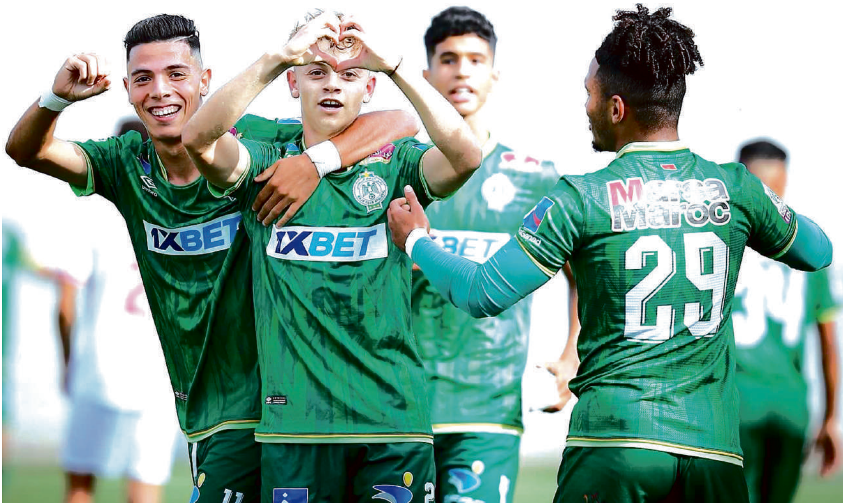
الرجاء يقرر التركيز على جانب التكوين

سلطات برشيد تفرض 3000 تذكرة فقط لمباراة «النسور» ضد اتحاد طنجة