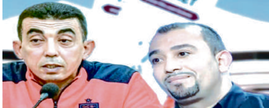
العماري والحيداوي المتابعان في قضية «تذاكر المونديال»

القاضي يقرر تغيير مستشار بسبب عملية جراحية وإدخال القضية مجددا للمداولة