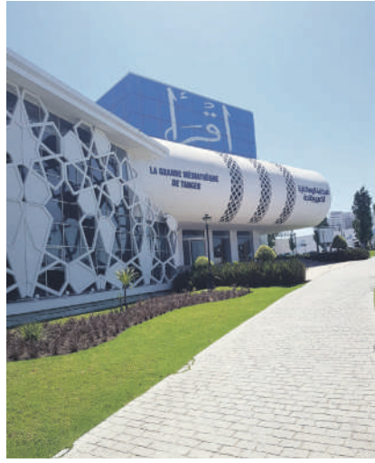
مكتبة إقرأ من المشاريع المتوقفة

ترابي لتسهيل ضمان العدالة المحلية وتحقيق التوازن بين المجالات القربية المستفيدة من البرامج موضوع الاتفاقيات، وأضاف المجلس، أنه تم إعداد البرامج والاتفاقيات من خلال تحديد لأئحة للمحاور والمشاريع وحصر الغلاف المالي لكل مشروع دون التوفر على معايير موضوعية ومضبوطة بالنظر إلى عدم إجراء دراسات جدوى عامة أو تفصيلية للمشاريع المزمع تنفيذها، وذلك حتى يتسنى الأخذ بعين الاعتبار الجوانب المالية والقانونية والتشغيلية والاجتماعية والبيئية للمشاريع واستشراف المخاطر التي يمكن أن تواجه هذه المشاريع لتفاديها قبل برمجةها، لاسيما في ما يخص توفر الأوعية العقارية المناسبة للمشاريع وواقعية المساهمات المالية للأطراف والشروط الكفيلة بضمان استدامتها. وهو ما نتج عنه عدم تمكن الأطراف المكلفة باستغلالها من المشروع في العمليات التشغيلية التي تتيح بلوغ الأهداف المنتظرة، كما هو الشأن بالنسبة للمشاريع السالف ذكرها بطنجة، مما أعاق الاستجابة إلى الحاجيات المعبر عنها ويطرح إشكاليات وأعباء للمديرين العموميين كان من الممكن تفاديها عبر مقاربة استباقية تقتضي اتخاذ قرارات وعقد شراكات قبل انتهاء التشغيل المتعلقة بالمشاريع التنموية.