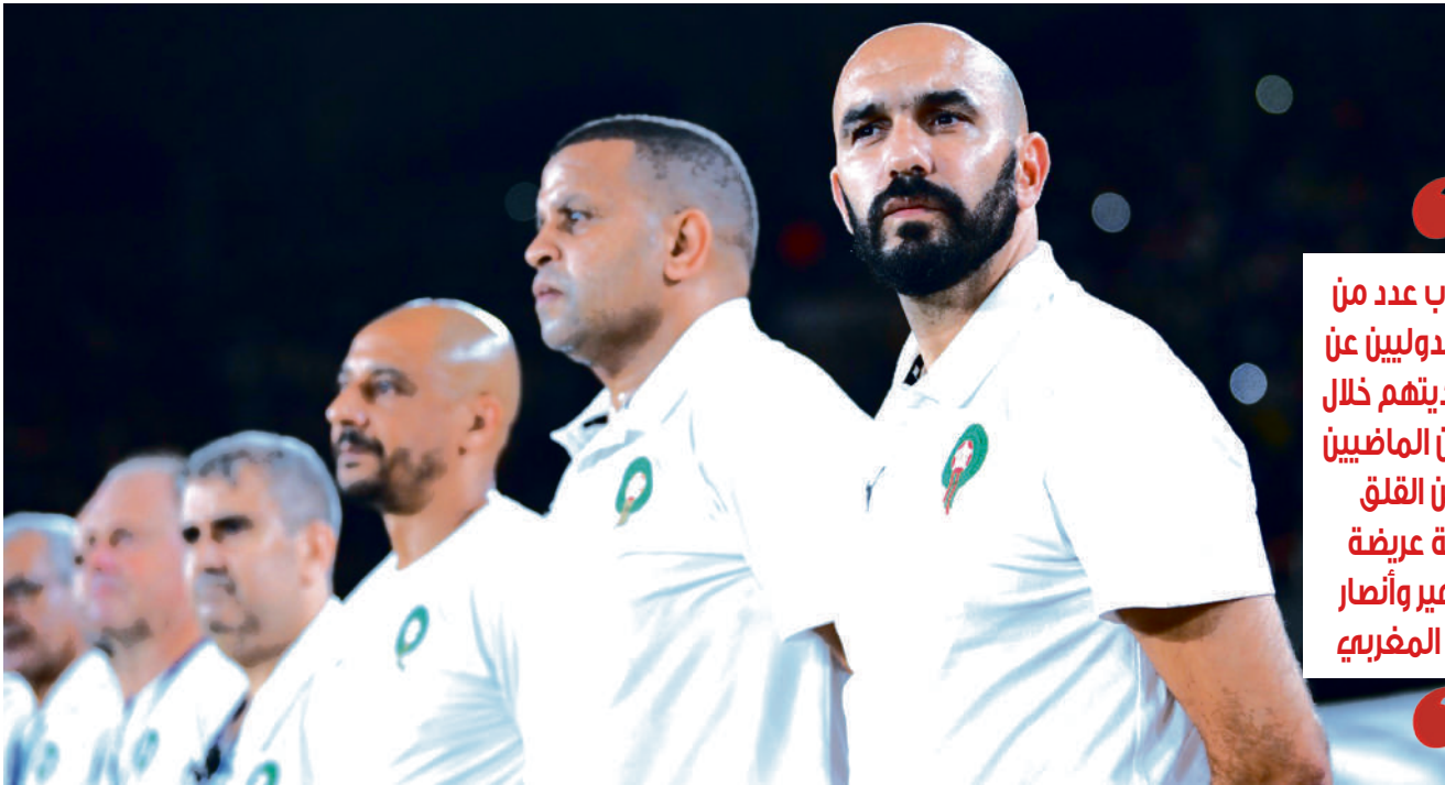
الركراكي حسم اللائحة النهائية للمنتخب المغربي

الإصابات وغياب الجاهزية أبرز المخاوف وارتفاع «كوطة» الأولمبيين مقابل المحليين