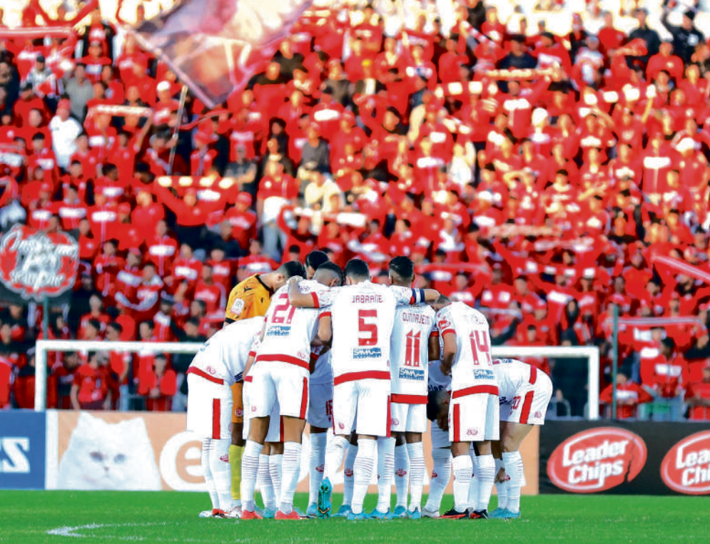
اللاعبون والآنصار يدعون إلى الالتحام من أجل تجاوز أزمة الوداد

وأعجب مدرب الوداد بآداء بعض لاعبي الفريق