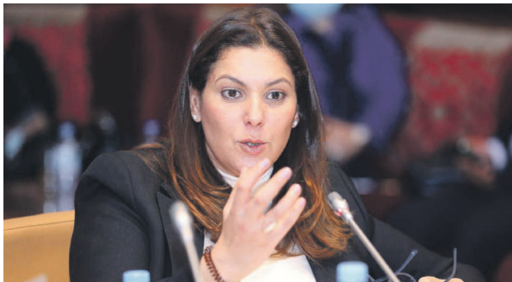
فاطمة الزهراء المنصوري وزيرة إعداد التراب الوطني والتعمير والإسكان وسياسة المدينة

حدد بقعا أرضية تابعة للشركة كمنطقة خضراء ومطالب بتدخل الوزيرة المنصوري