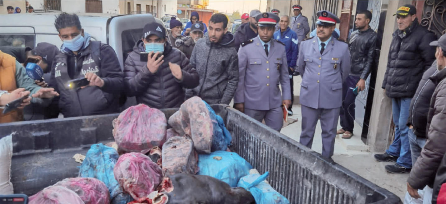
اللحوم المحجوزة من طرف الدرك